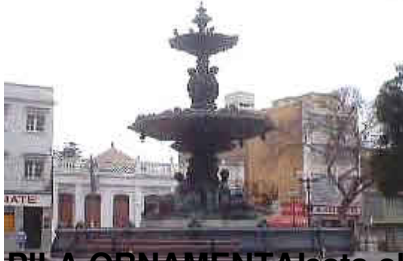
LA PILA ORNAMENTAL Esta obra escultórica tiene 6 metros de altura estuvo a cargo del Francés