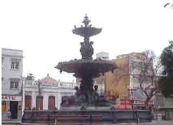
PROVINCIA DE TACNA