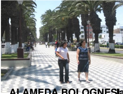
ALAMEDA BOLOGNESI La hermosa alameda Bolognesi de la que con justicia se enorgullece la c

Escrito por tvsurperu.com - Última actualización Domingo 03 de Enero de 2010 20:56